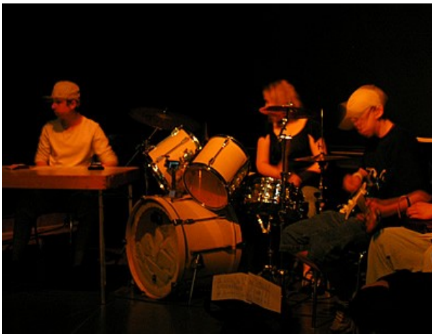
in der Performance