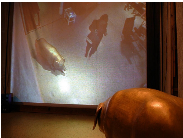
in der Klanginstallation von Willehad Grafenhorst