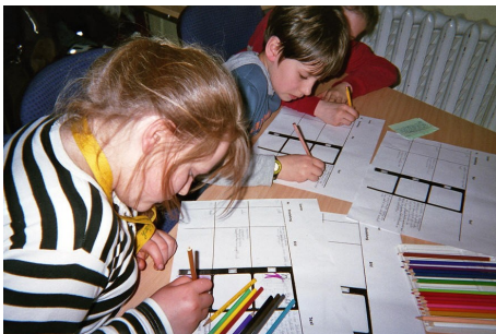
Drehbuchworkshop mit den Kindern - Storyboard schreiben