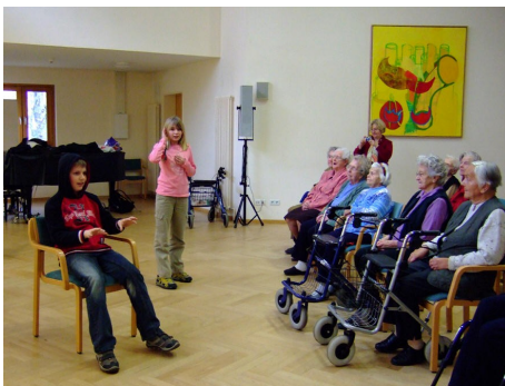
Szenische Lesung im Lothar-Kreyssig-Haus