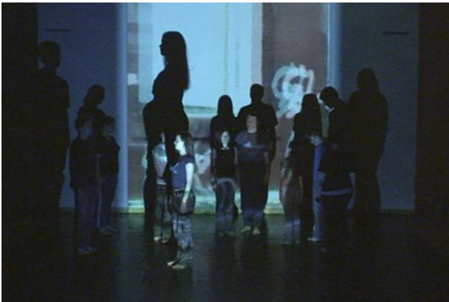
in der Aufführung

Gefördert durch: Kulturstiftung des Freistaates Sachsen, Soziokultureller Jugendfonds der Stadt Chemnitz