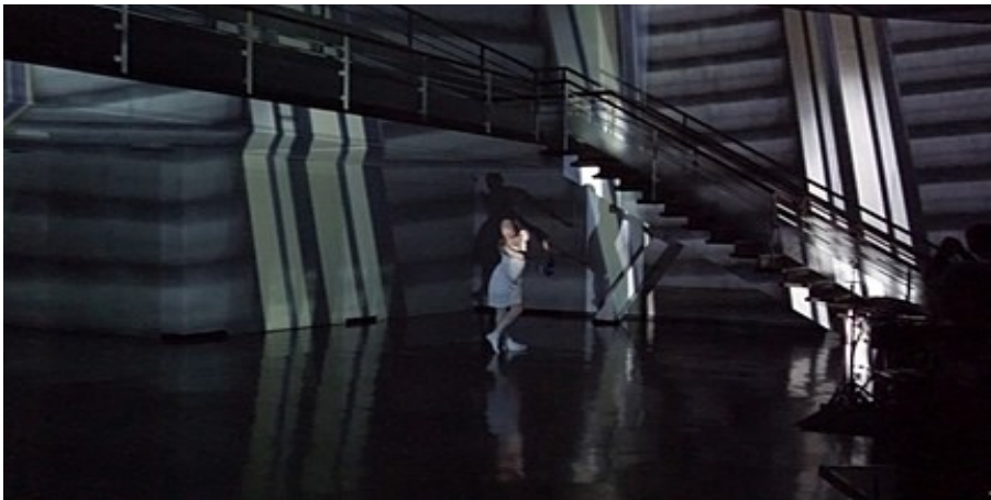
Video: Willehad Grafenhorst Tanz: Fine Kwiatkowski

gefördert durch: die Städte Wiesbaden und Giessen