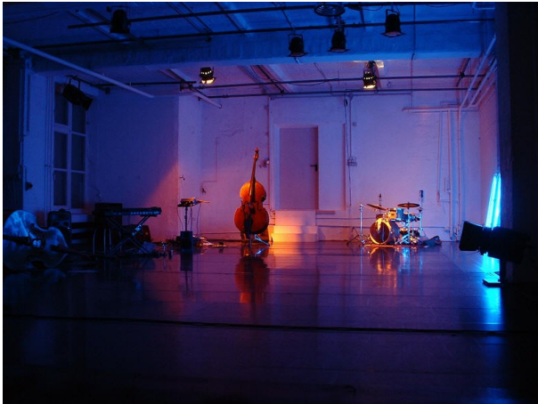
vor der Aufführung

Aufführungen 25.-27.02. im LaborGras, Berlin