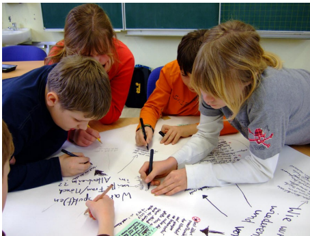
Drehbuchworkshop mit den Kindern - Ideen sammeln

Im Rahmen des Förderprogramms dieGesellschafter.de der Aktion Mensch