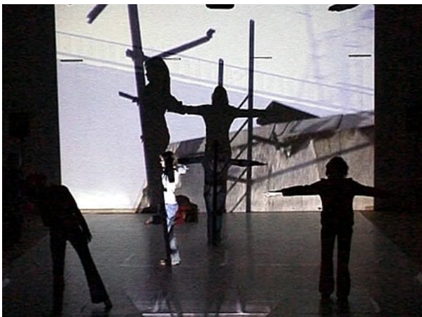
Aufnahme während der Performance

gefördert durch: 5.000 x Zukunft eine Initiative der Aktion Mensch